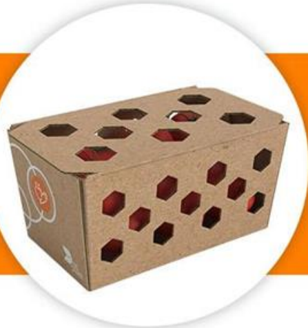
Κουτάκι με καπάκι