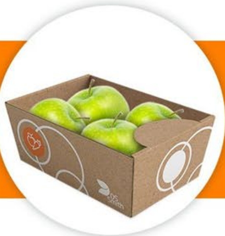
Тарелки без капак