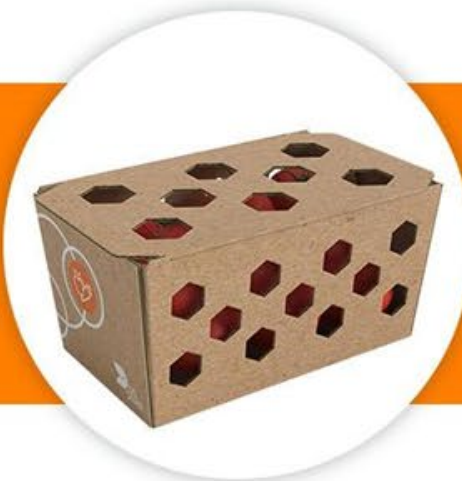
Тарелки с капак